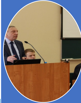
Учебно-методическая секция по вопросам подготовки студентов по управлению персоналом