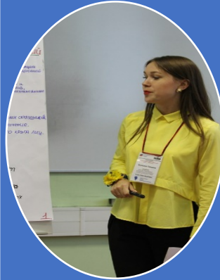
Всероссийский конкурс научно-исследовательских проектов по управлению персоналом и экономике труда для студентов и аспирантов