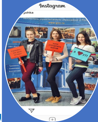
Конференция «Best HR for New HR. Вся правда об управлении персоналом в меняющемся мире»

Подробности по адресу: http://hrkibanovforum.ru/?page_id=175