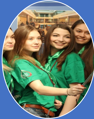
Всероссийская студенческая олимпиада «Управление персоналом: вчера, сегодня, завтра»